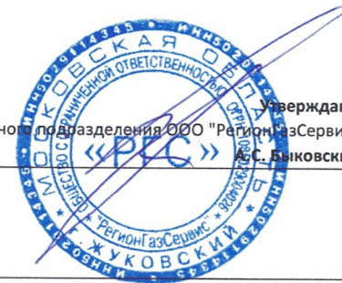
ГРАФИК № 2 проведения технического обслуживания внутриквартирного газового оборудования, в МКД находящихся в управлении ООО МУП Межрайонный Щелковский Водоканал г. Щелково на Октябрь 2021 года