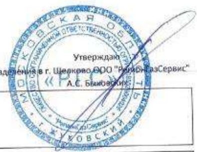
ГРАФИК проведения технического обслуживания внутридомового, внутриквартирного газового оборудования, в многоквартирных домах. на июнь 2023 года

Руководитель подразделения в г. Щелково ООО "РегионГазСервис"